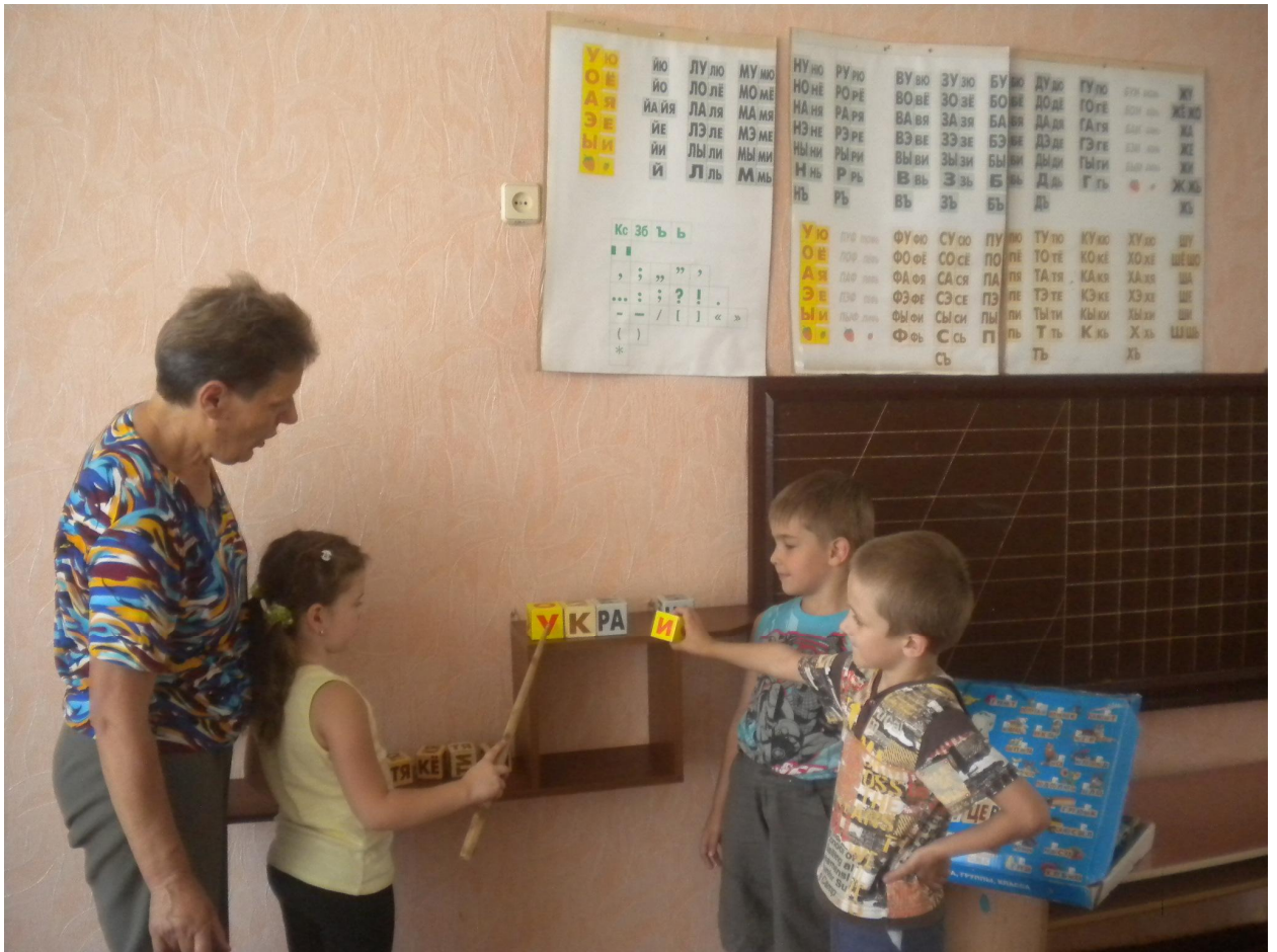
Рис.6.1.1 Заняття з навчання читанню дітей за методикою М. Зайцева