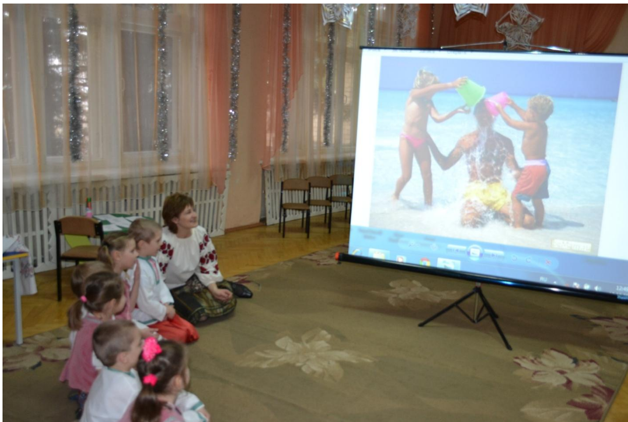
Рис. 6.4.2 Робота практичного психолога

ігри та тренінги на корекцію негативних емоцій та зняття неврологічних етапів, включаючи індивідуальну роботу з дітьми, яка направлена на профілактику відхилень розвитку.