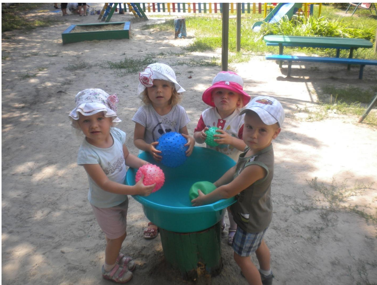
Рис. 6.4.1 Загартовуючі процедури дітей раннього віку